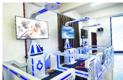
▲校内数智旅游实训室