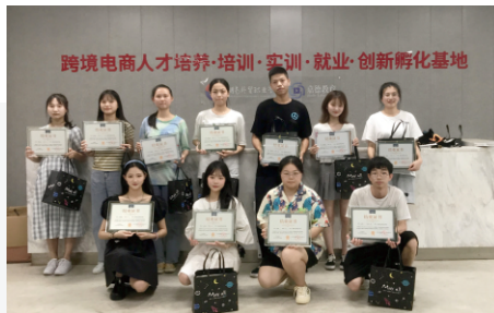
▲跨境电商校内培训·实训·就业·创新孵化基地