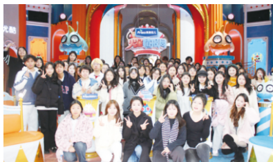
▲学生参与《火星情报局》节目录制