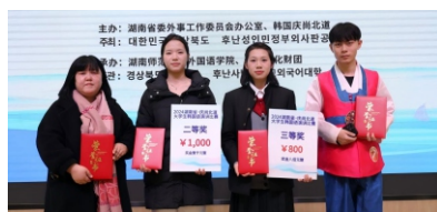
▲湖南-庆尚北道韩语演讲大赛获奖