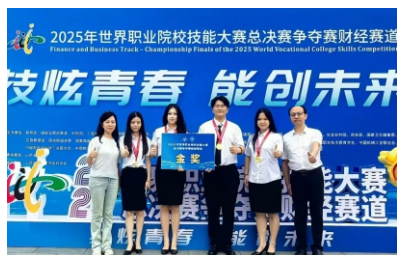
▲2025年世界职业院校技能大赛总决赛财经赛道金奖

◆ 就业方向 ：面向智能财务系统提供方、智能财务系统专业服务组织与智能财务系统使用组织（含企事业单位、会计与税务中介服务机构、政府机关）的会计、审计、税务、软件和信息技术服务等职业，包括财务BP、财务IT、财务咨询、智能财务系统建设、智能财务系统运维、业财数据治理、业财数据分析和可视化呈现、AI+财务创新等岗位（群）。