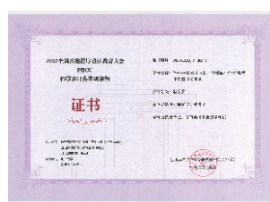
▲教学案例《Python驱动无人机三维建模》荣获2025年全国高校程序设计大赛特等奖