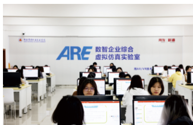
▲ARE数智企业综合虚拟仿真实验室