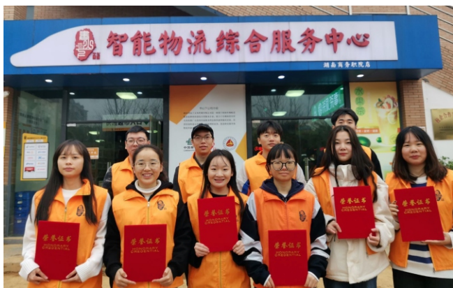
▲学生线下实训活动