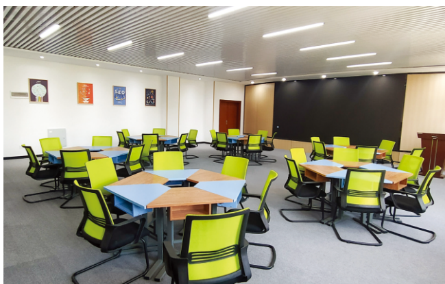
▲智慧零售数据中心

◆ 就业方向 ：毕业生主要面向交通运输、仓储和邮政业、航空运输业等领域，担任物流无人机操控员、低空物流运行调度员、无人机起降场管理员等岗位，能够胜任无人机运行操控与管理、低空物流系统运营、无人机起降场安全运维与应急处置等专业技术工作。