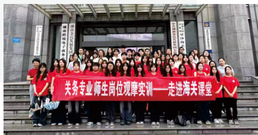
▲产教融合·走进海关课堂