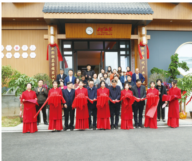
▲湘茶现代产业学院挂牌成立并运营

◆ 就业方向： 茶叶生产技术人员、茶饮料及精制茶制造人员、茶叶品质管理与茶艺服务培训人员、茶叶销售人员等岗位。