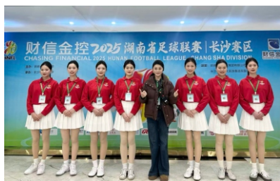
▲我校空中乘务专业学生以专业服务湘超赛事

◆ 就业方向 ：从事会议、会展公司及场馆等相关企业从事会展策划师、会议服务接待师、会展营销专员、会展项目管理、会展运营主管等岗位。可进入企事业单位的市场部、公关部或文旅、婚庆、体育赛事公司从事活动策划与组织管理、婚庆策划与管理等岗位。