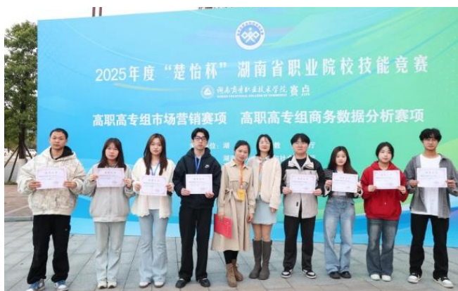
▲2025年度“楚怡杯”湖南省职业院校技能竞赛市场营销赛项一等奖

数据智能与分析决策方向：可从事运营数据分析专员岗位，发展岗位为生成式AI产品经理（技术营销方向）。