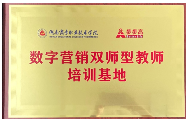
▲数字营销双师型教师培训基地