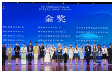
▲世界技能大赛旅游赛道金奖