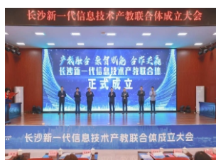
▲成立长沙新一代信息技术产教联合体