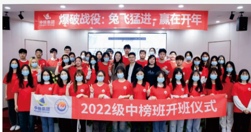
▲校企合作中榜订单班