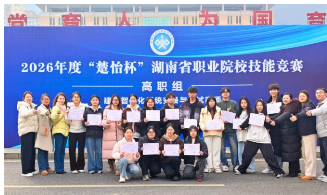
▲2026年湖南省职业院校技能竞赛电子商务赛项一等奖

◆ 就业方向： 服务国家乡村振兴战略，培养具备农产品电商运营、数字营销与品牌推广、电商客户服务与管理、供应链管理等能力的复合型技术技能人才