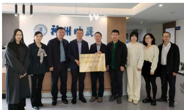
▲校企合作共建数字经济产业学院