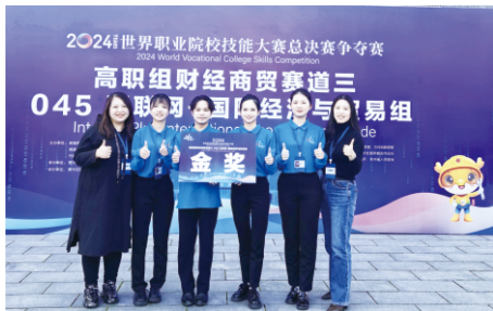
▲2024年获世界职业院校技能大赛金奖

◆ 就业方向 ：面向报关行、货代公司、外贸企业、跨境电商平台及口岸物流企业的外贸单证处理与复核、通关现场操作、国际货代现场操作、货代客服与质量监控、跨境电商服务等岗位。