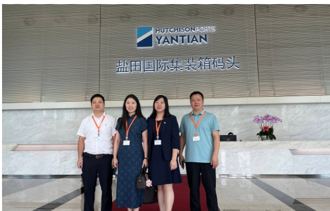
▲校企合作实训基地