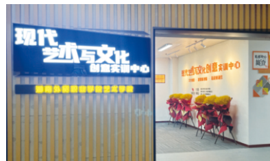
▲艺术学院-现代艺术与文化创意实训中心