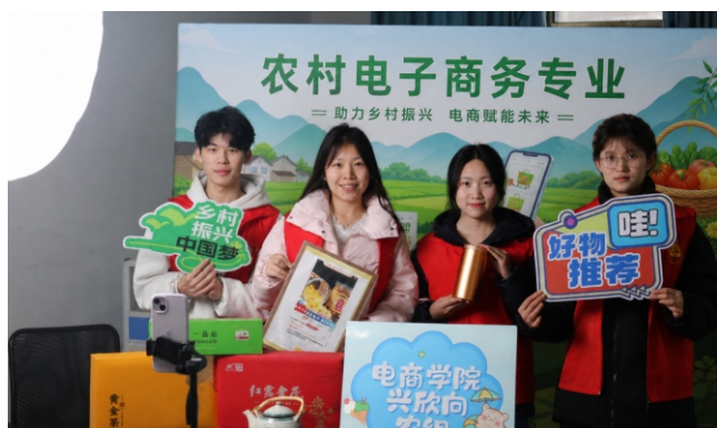
▲农产品直播带货实训