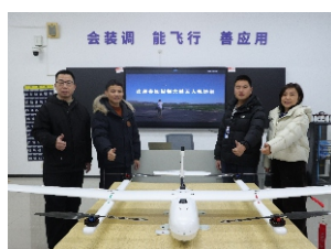
▲无人机组装与调试实训室