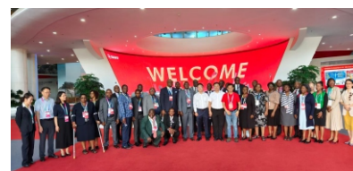
▲商英教师团队在中非经贸博览会期间全程接待津巴布韦代表团参观企业