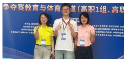
▲英语教师团队指导学生参加2025年世界职业院校技能大赛获铜奖

◆ 就业方向 ：面向外事、经贸、旅游、制造等行业或企事业单位，从事翻译、笔译、外事接待、企业文员、外贸业务员、跨境电商服务等岗位。