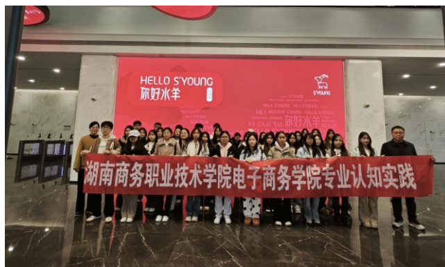
▲学生赴水羊集团开展实践活动