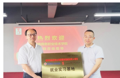
▲与东莞百正税务师事务所有限公司签约校企合作实训基地