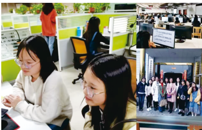
▲与中国邮政校企合作育人