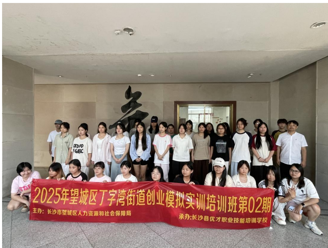
图 6 组织学生参加创业模拟实训培训班

学生创业认知与实践能力。2025 年学生考证通过率达 98%，远高于全省平均水平。