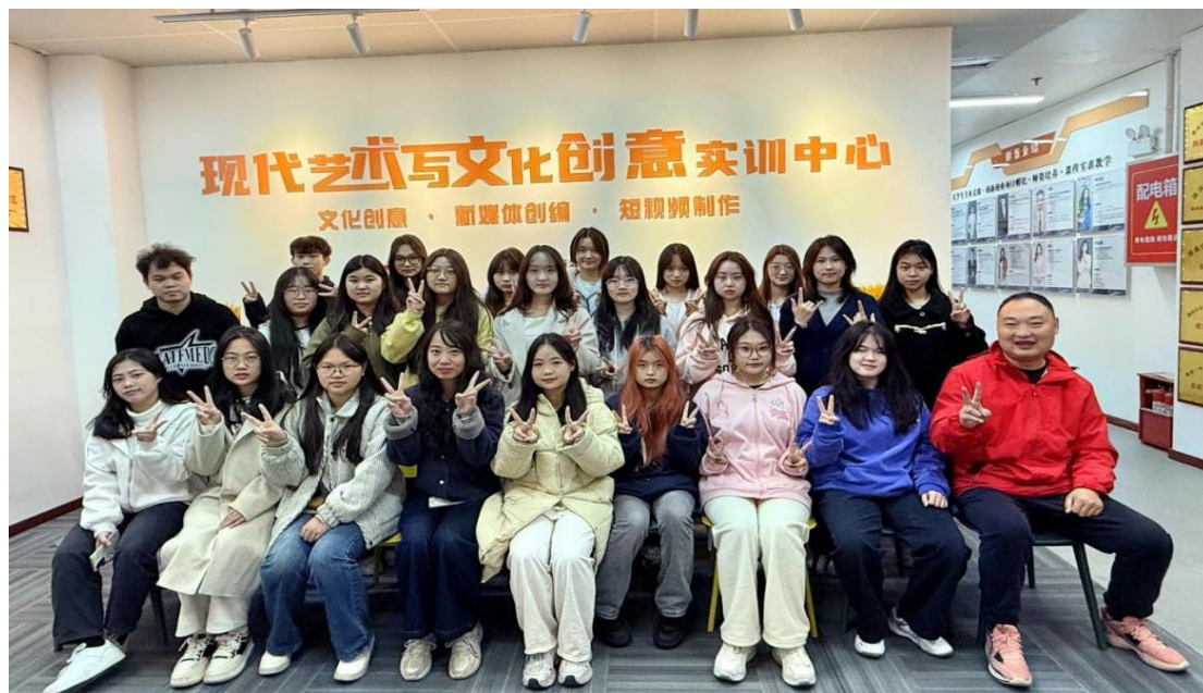
图 1 现代艺术与文化创意实训中心

(1000 m 2 ) 和 “乐田智作长沙影视制作基地” (30000 m 2 ) 3 个校外实习实训基地（见图 2），总面积超 30000 平方米，提供实训实习与就业岗位超 500 个，形成“校内+区域+产业”三级实训基地网络，为学生提供真实的职业环境和项目实践机会。