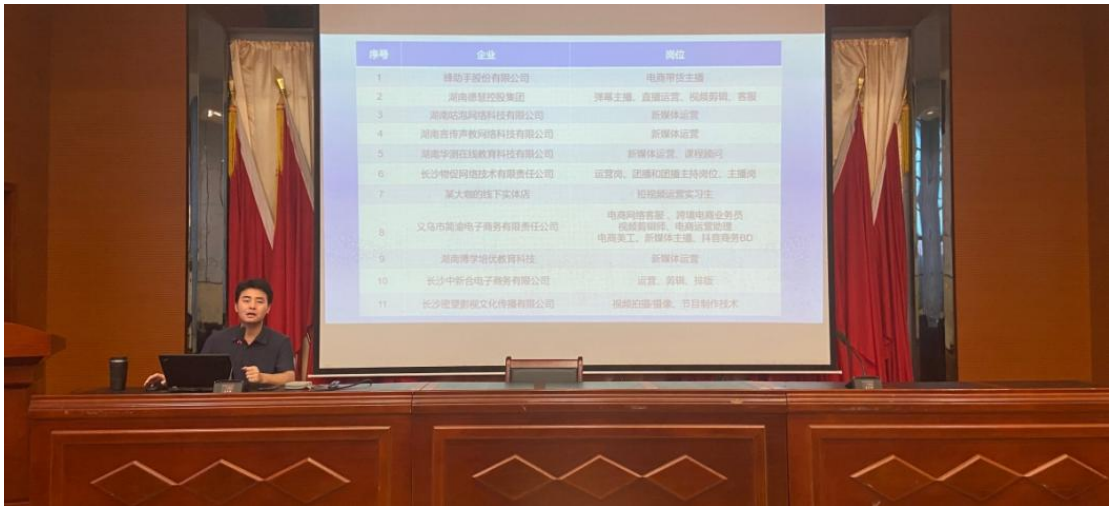
图 12 整合产业园区与企业资源进行专场招聘会