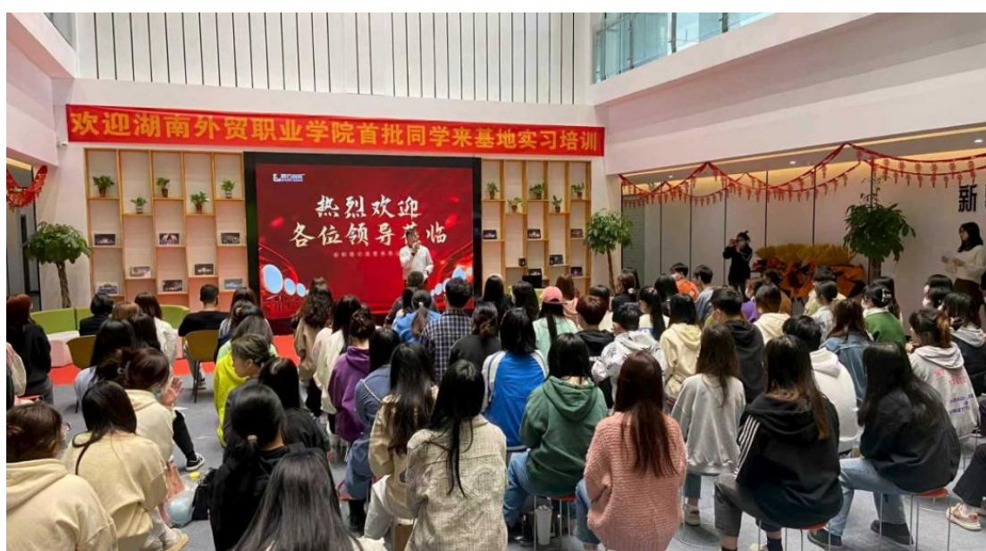
图 10 校企联合组织学生进行岗位实习

实训质量保障：制定《岗位实习分层管理规范》，建立实习质量评价指标体系，实施全过程跟踪管理，确保实训质量。2025 年，198 名学生 100%完成企业实习，190 人获得企业录用（96%）。