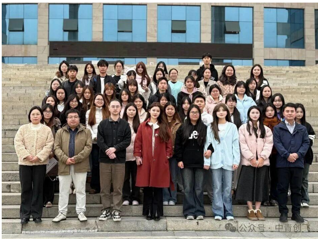
图 16 中青乐智接收的优秀毕业生与实习生合影