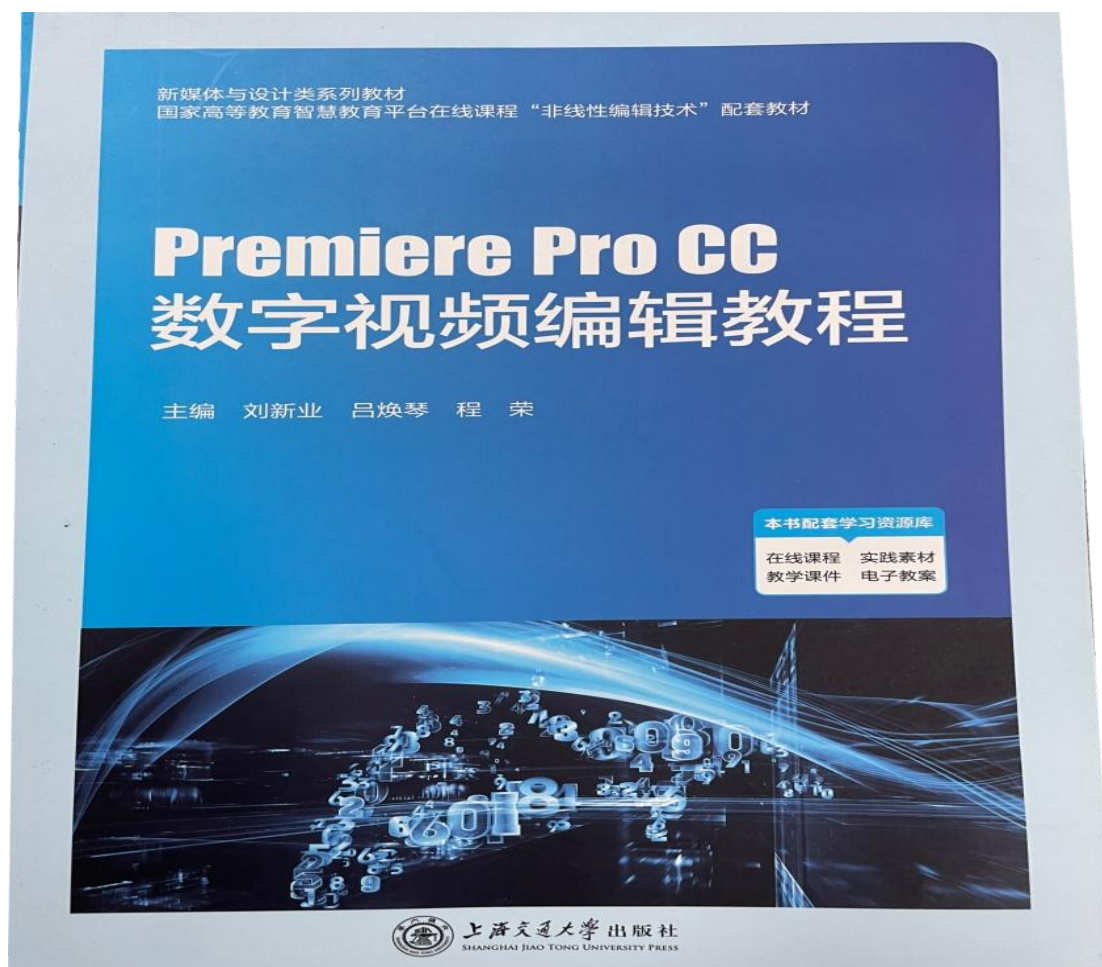
图 5 校企联合开发《数字视频编辑教程》教材已出版