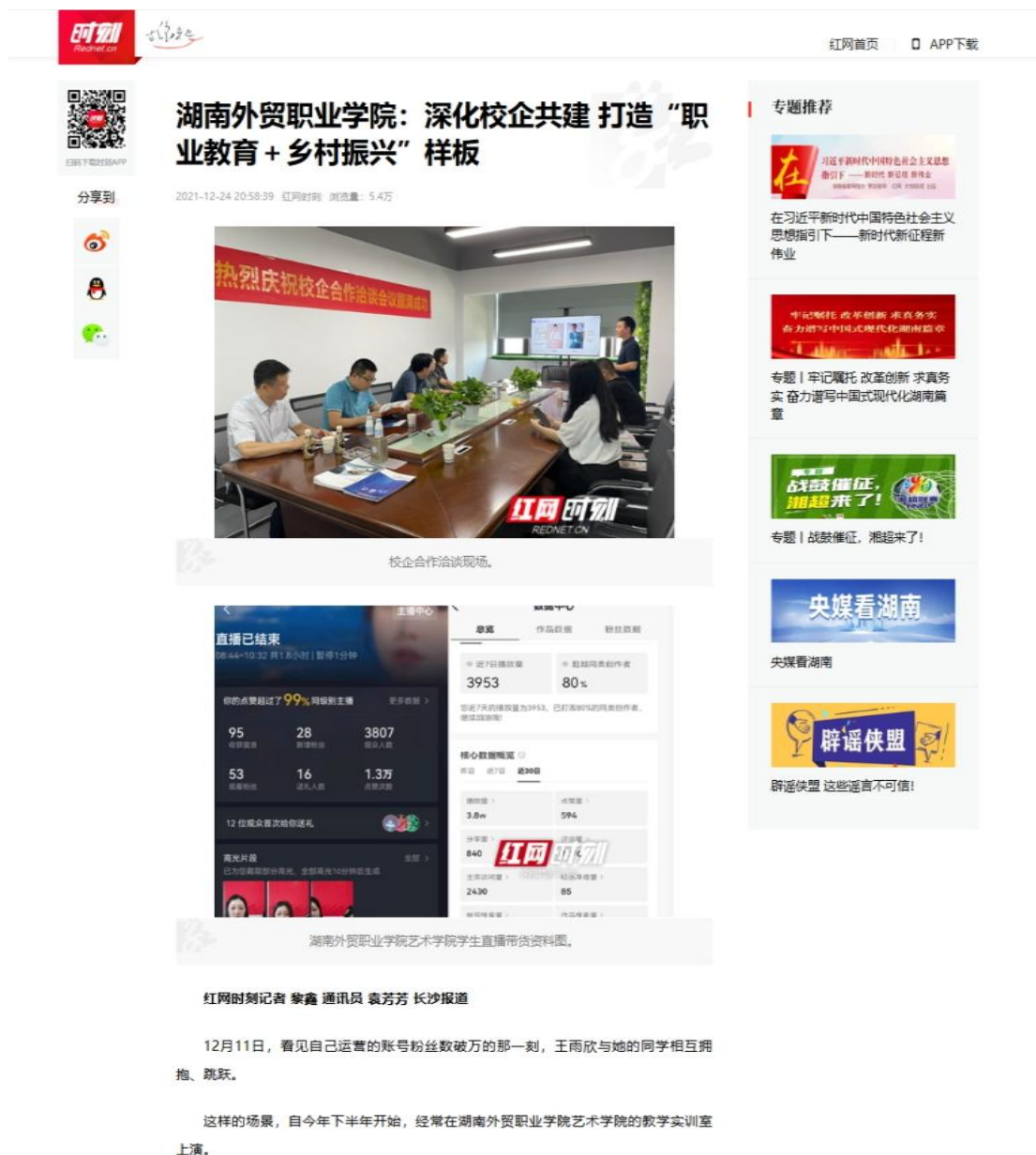
图 14 红网报道校企合作成果与模式