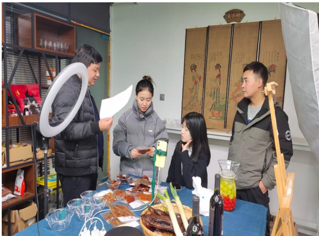
图 11 中青乐智企业导师现场教学