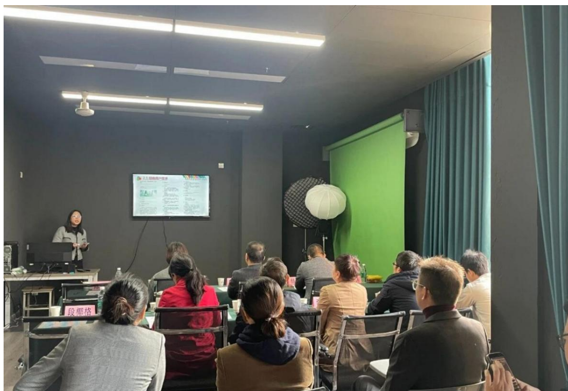
图 3 企业导师团队与校内教师联合教研活动

双师团队建设：建立企业导师认证标准，从专业能力、教学能力、育人能力三个维度设置 12 项指标，认证企业导师 20 人，构建校企混编教学团队，实现优势互补、协同发展。