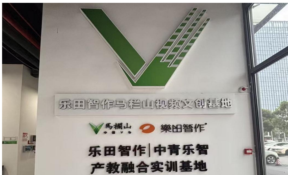
图 2 乐田智作&中青乐智产教融合实训基地