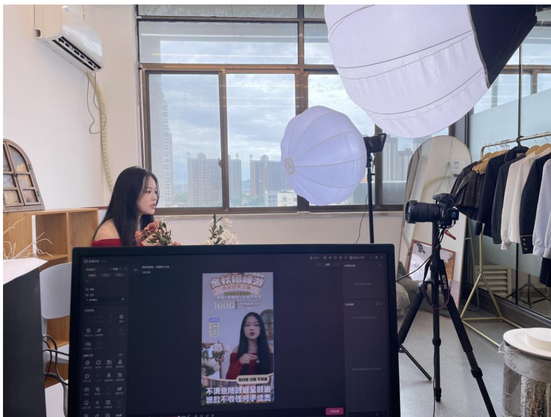
图 9 学生在校内实训基地进行直播项目实战