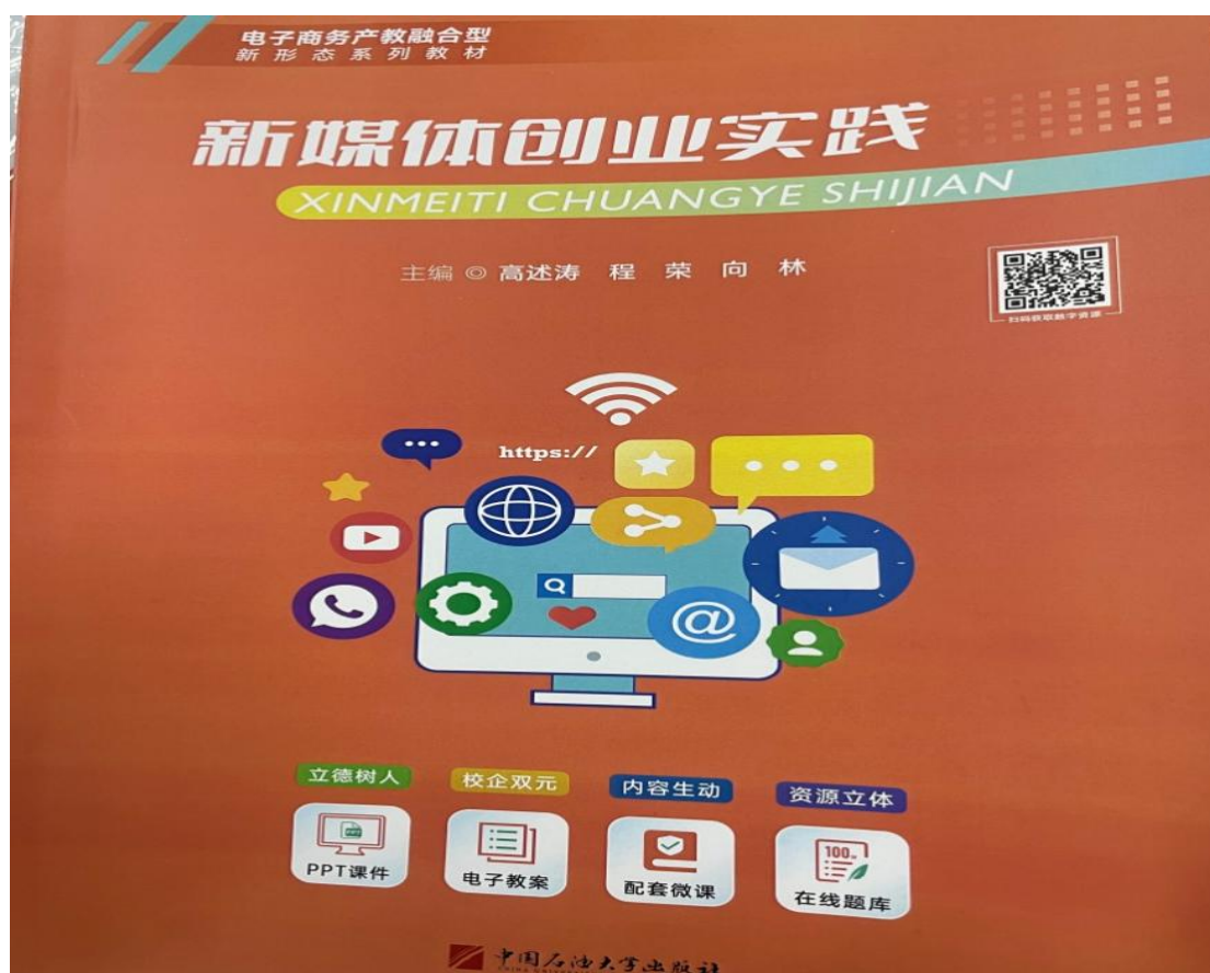
图 4 校企联合开发《新媒体创业实践》教材已出版

课程标准建设：校企共同制定 6 门专业核心课程标准，将企业最新技术标准、岗位能力要求、工作流程融入教学内容，确保教学与产业需求无缝对接。