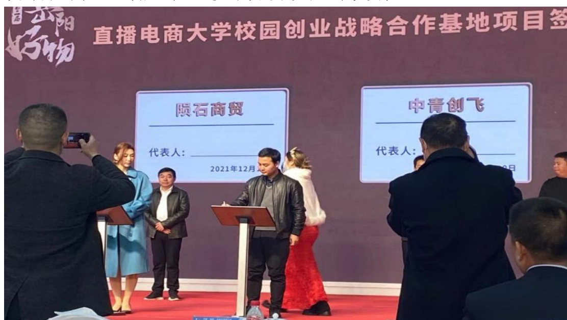
图 15 岳阳自贸片区签约直播电商孵化基地

信创人才培养：2025 年，联合麒麟软件、长沙商贸旅游职院成立“麒麟信创产业学院”，开设软件技术（信创方向）专业，培养适配国产操作系统的应用型人才。成为“楚怡杯”信创赛项技术支持单位，服务湖南省信息技术应用创新产业发展，为区域信创生态建设提供人才支撑。