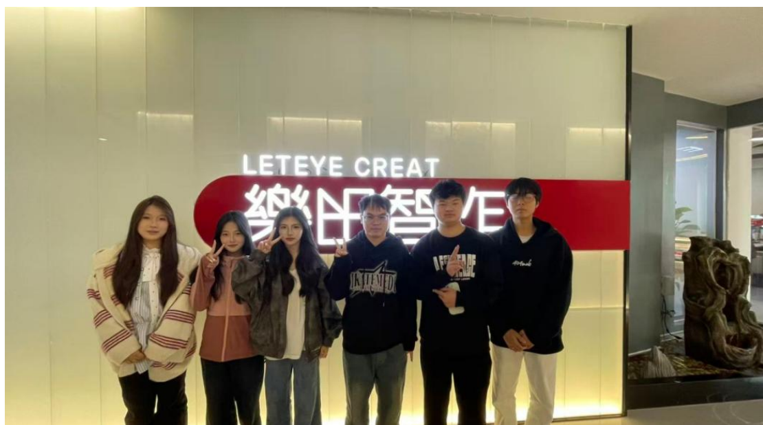
图 8 带领困难学生前往乐田智作进行就业推荐

就业推荐通道：与乐田智作、湖南咕泡网络科技有限公司等 15 家企业共建困难学生就业绿色通道，2025 年成功推荐所有困难学生就业，就业率达 100%，高于学校平均水平。