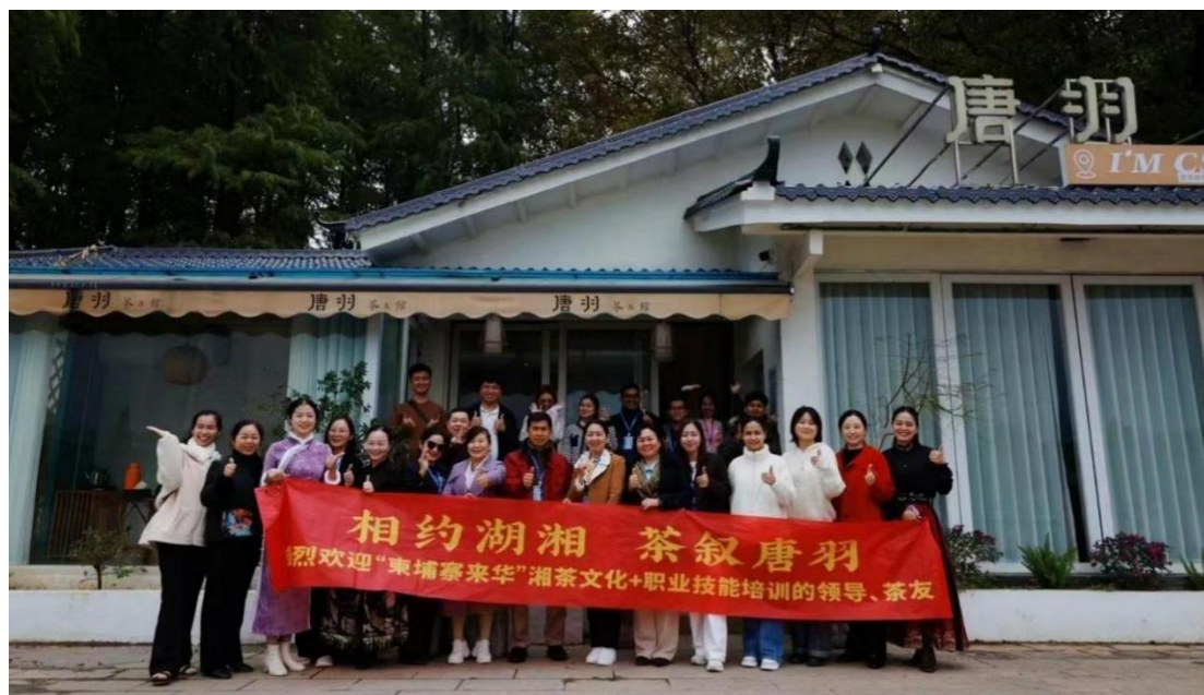
图1 唐羽为商务职院主办的柬埔寨来华“湘茶文化+职业技能”培训提供场地支持

为落地落实湖南省茶业集团、商务职院与柬埔寨中资企业、柬埔寨高校签署的国际合作协议，作为湖南省茶业集团的控股公司，唐羽接待20名柬埔寨来华学员开展“湘茶文化+职业技能”培训，并提供培训场地、培训师、茶叶、茶点等支持（见图1）。2025年，唐羽与商务职院共同出资赴柬埔寨举办了“湘茶文化+职业技能”培训。唐羽为培训提供高级茶艺师1名，并提供了部分培训用的茶叶、茶具和承担了企业师资往返柬埔寨国际旅费以及在培训期间的开支等费用共计1万余元。