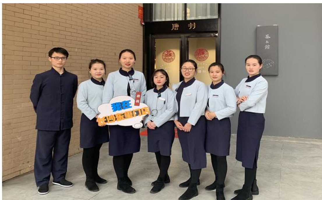
图 14 唐羽招聘商务职院学生入职

这样，无论是外部引入的新生力量，还是内部成长起来的骨干人才，都能在公司找到施展才华的舞台，共同推动公司向着更高的目标奋勇前行，从容应对市场的种种挑战，于行业浪潮中稳健领航。