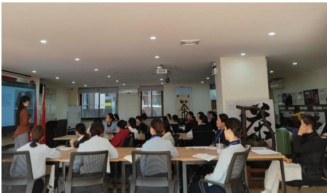
图 12 唐羽企业导师为商务职院学生开展培训

目前，商务职业已有 13 名应届生正在唐羽进行实习。通过前期系统的培训以及当下的实践实习，学生们得以将理论与实际紧密结合，在茶行业的探索之路上稳步前行，向着成为专业的茶行业人才迈进。