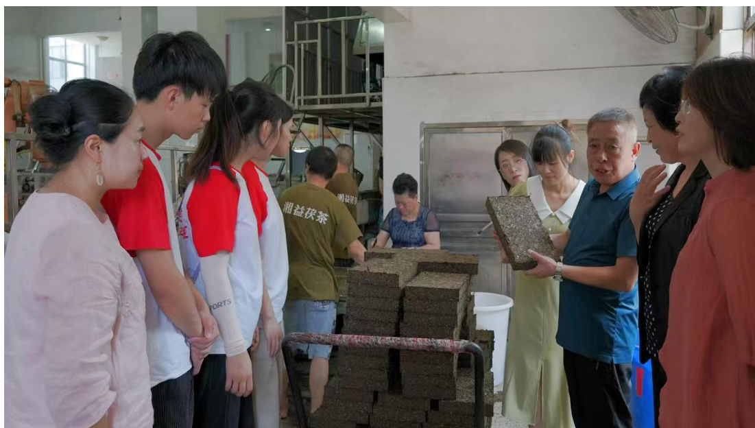
图 4 企业导师现场授课