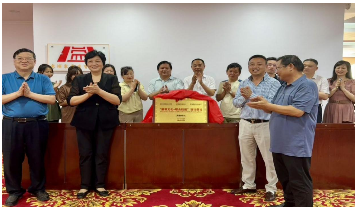
图 5 校企协在柬埔寨金边举行“‘湘茶文化+职业能力’培训基地”揭牌仪式

就开展“中文+茶苗繁育、茶园（种植）管理、茶叶加工、茶叶精制（拼配）、茶艺、评茶、茶文化推广、茶品牌策划与营销”等涉茶职业技能培训，打造五彩湘茶海外营销窗口等方面达成共识，并在柬埔寨金边揭牌成立了“‘湘茶文化+职业技能培训’基地”（见图5）。同年11月，湖南省茶业集团与商务职院共同出资12万余元联合开展了柬埔寨来华“湘茶文化+职业技能”培训。20名来自柬埔寨波雷烈国立农业大学的师生代表、柬埔寨健康农业公司的员工代表参加了为期7天的培训。来自柬埔寨的学员不仅学习了中文和湘茶职业技能，还把友谊与湘茶文化带回国内，为湘茶文化的传播与拓展五彩湘茶在东南亚国家的市场打下了良好的基础。