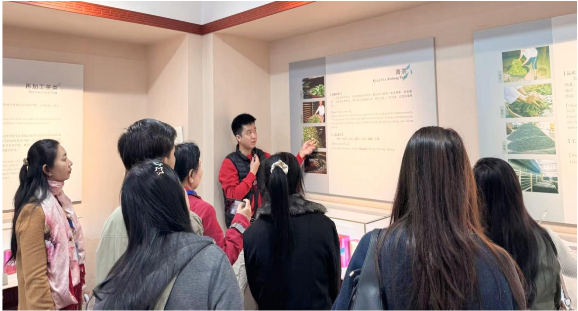
图 6 柬埔寨来华“湘茶文化+职业能力”培训班学员参观湖南茶叶博物馆