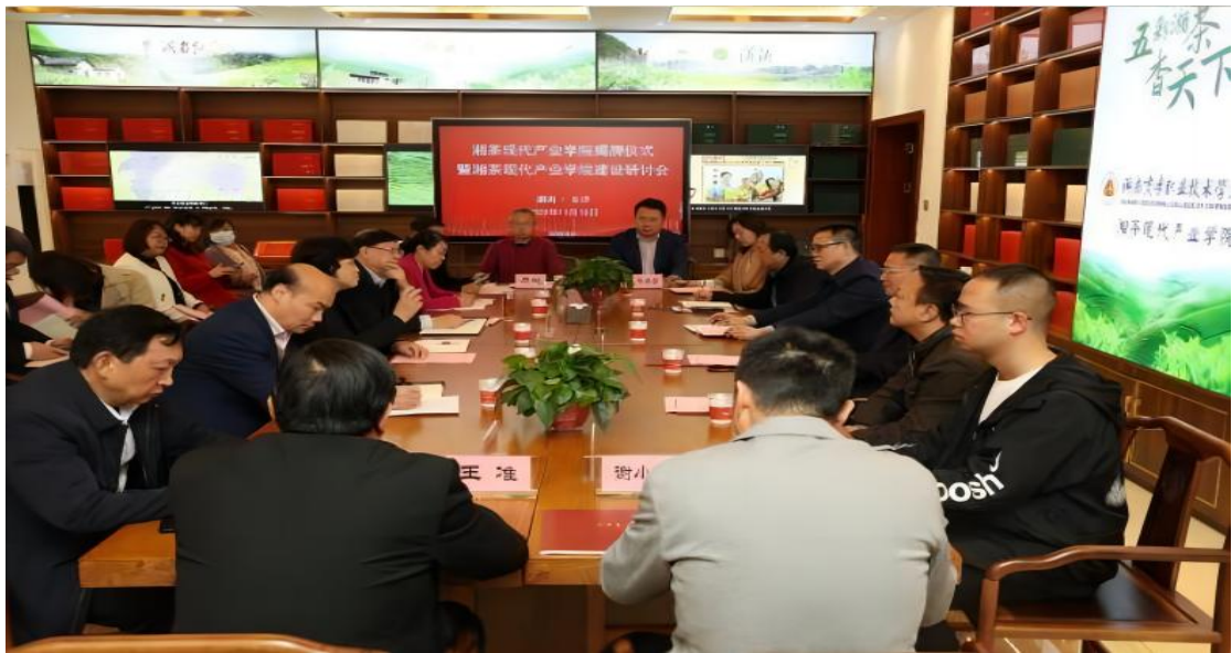
图 2 成立“湘茶现代产业学院”，共同探讨人才培养模式