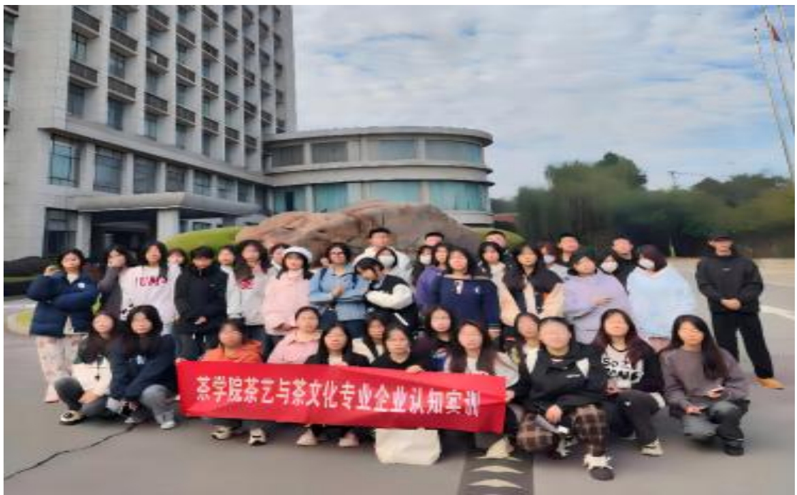
图 3 学生在校企共建实训室实习、见习