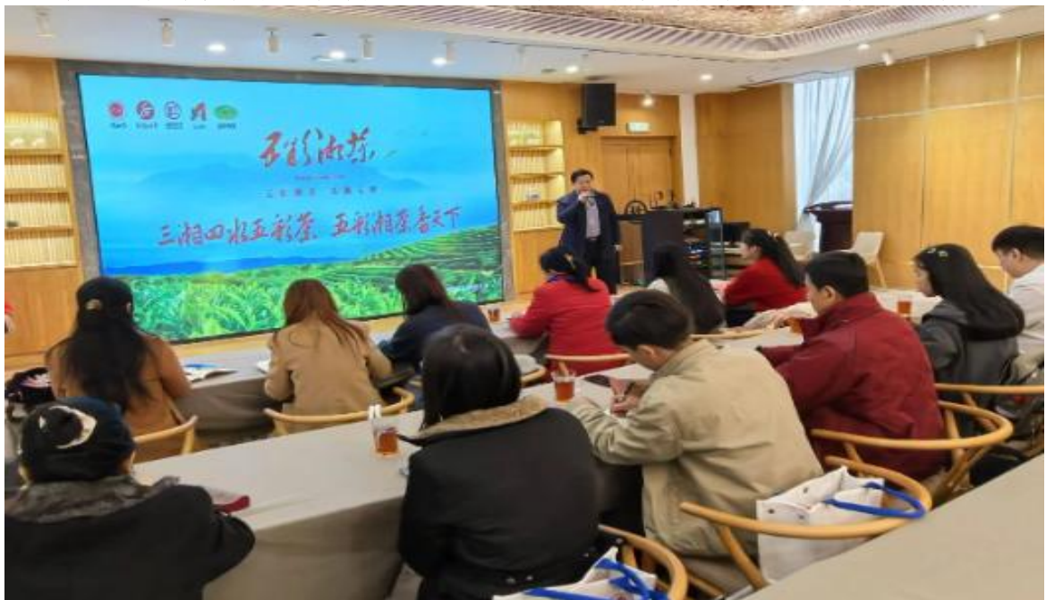
图 7 湖南省茶业协会秘书长为柬埔寨来华“湘茶文化+职业能力”学员授课