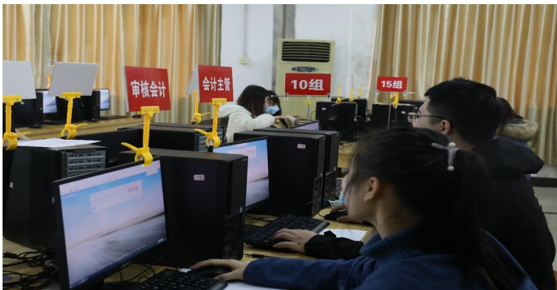
图1 专一网云上实训平台实训室实景图

专一网·云上实训平台包括商贸业、工业、服务业、金融业、房地产业、外贸业、建筑业、行政事业单位、社区乡级、农林牧渔等11个行业会计岗位的全真实训案例，以真实企业为背景，以全真原始凭证形式提供企业当月发生的经济业务资料，要求用户对当月经济业务进行手工核算处理，内容涉及原始凭证的审核和填制、记账凭证的编制与审核、会计凭证汇总业务、成本计算与分析、对账与结账、错账查找与更正、财务报表编制与分析、税务发票的填开与认证及纳税申报等基本技能，是真账顶岗会计实训。涉及基础会计、会计实务、纳税实务、财务管理、成本会计五门核心课程。通过该实训平台引导学生进入岗位场景进行实战训练和业务对接，教学相辅、形象生动，操作性强，可充分调动学生学习的积极性，培养学生数据分析、管理能力、提升学生的业务、财务、税务、等实务经验。会计综合实训提升学生会计技能和财务管理能力，提升老师专业素质。