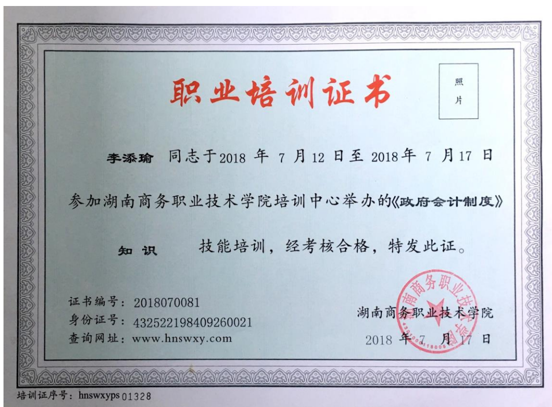
图3 《政府会计制度》培训证书