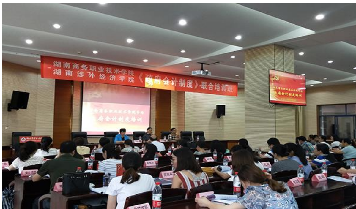
图2 《政府会计制度》培训班现场